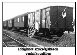
Ideiglenes szükségllakások vasúti kocsikban